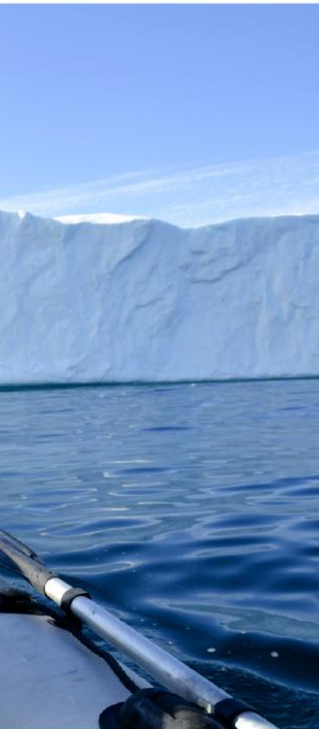
Grönland. Nu väntar en fortsättning från New Foundland, via